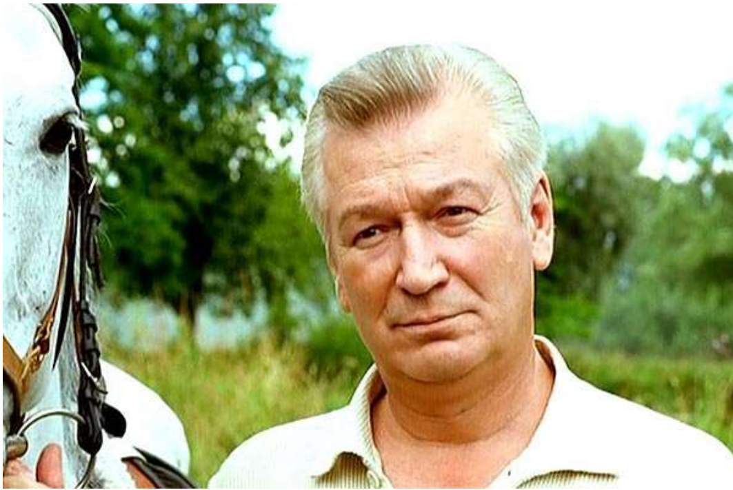
1973 — Сергей Стиллавин, радиоведущий.