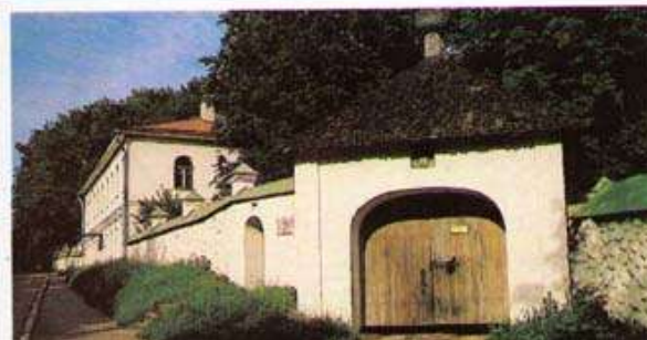
• «Святые ворота» Святогорского монастыря

1927 — В Ленинграде на заводе «Светлана» начато производство миниатюрных лампочек для карманных фонарей