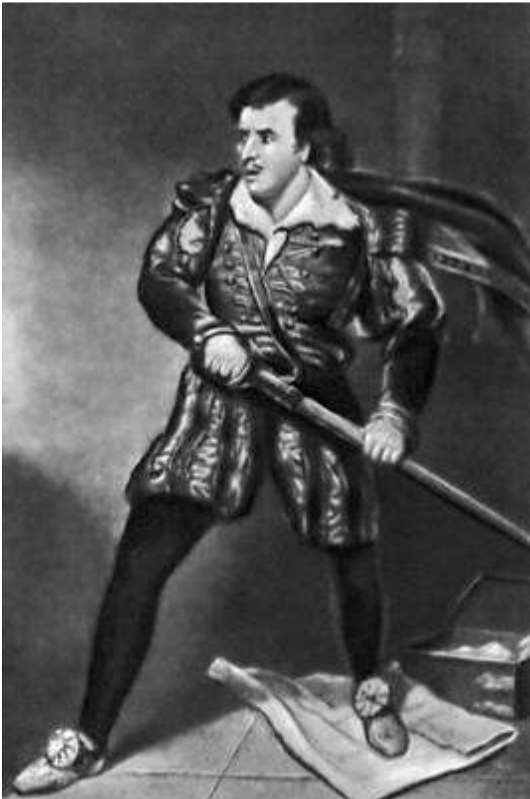
1939 — Джованни Трапаттони, итальянский футболист и тренер.