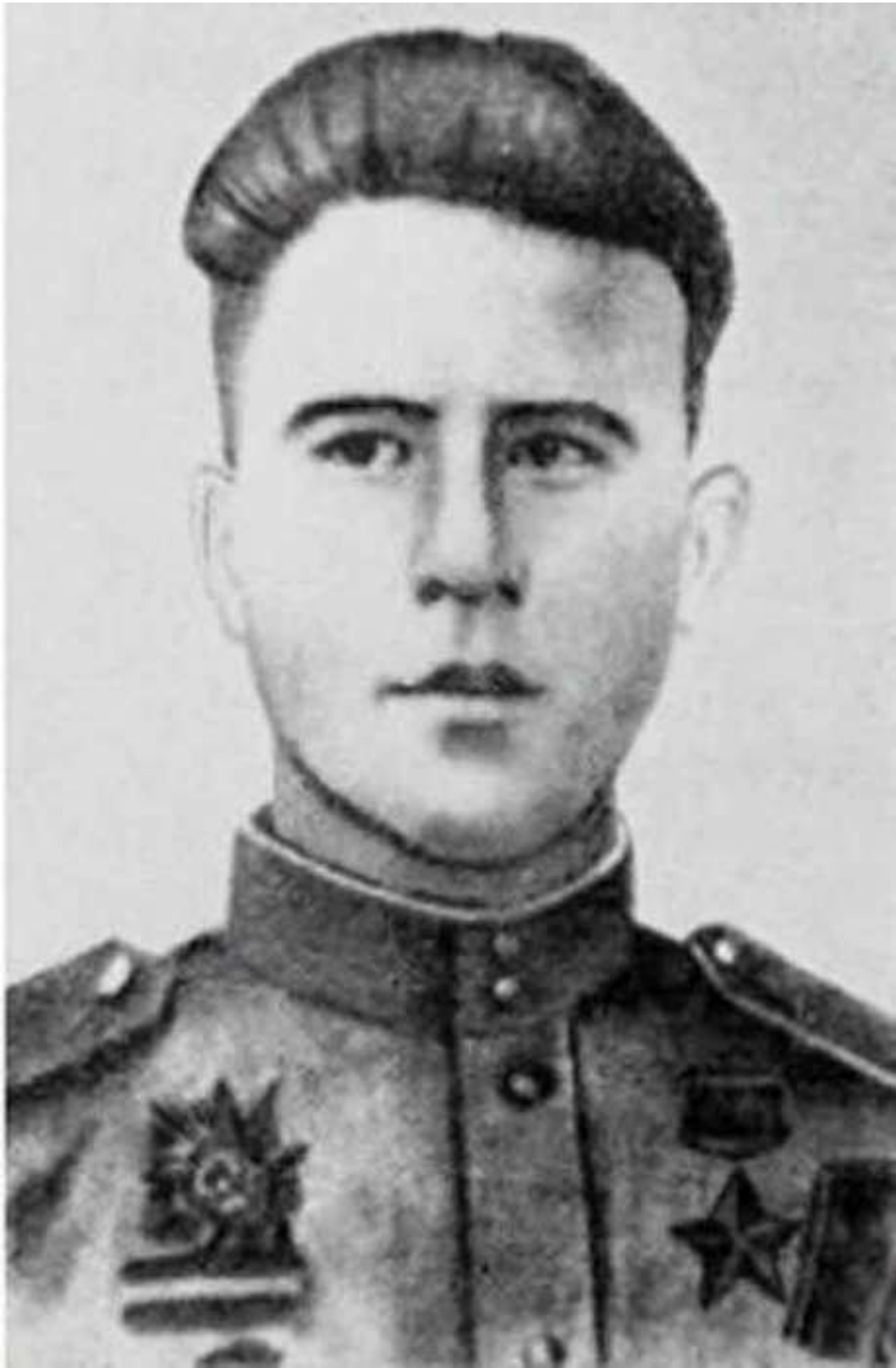
1925 — Юлия Константиновна Борисова, актриса Театра им. Вахтангова, народная артистка СССР.